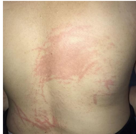
Figura 2 e 3 - Evolução das lesões na face no segundo dia e no quinto dia no dorso (respectivamente) após a ingestão do Shiitake.

Ao exame físico, destaca-se a presença de lesões múltiplas no tronco, raízes dos membros inferiores e superiores, linhas eritematosas, entrecruzadas ou não, em formato de chicotes, com petéquias que não desaparecem à pressão digital (Fig. 1 e 2). Não foi detectada lesão em mucosas. Os exames laboratoriais tiveram resultados normais e as lesões se apresentavam com discreto extravasamento hemático na derme superficial, inespecífico. Com base na anamnese e nas características típicas das