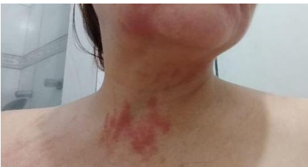
Figura 1 - Aparecimento das lesões no segundo dia após ingestão do Shiitake em face, colo e pescoço.

Apresentamos o caso de uma mulher de 53 anos que buscou atendimento médico por apresentar exantema pruriginoso de 48 horas de evolução. Na anamnese, relatou ter ingerido alguns cogumelos 24 horas antes do aparecimento das lesões. Encontrando-se afebril e negando uso prévio de qualquer medicamento ao aparecimento dos sintomas cutâneos e sem febre, dores articulares ou sintomas sistêmicos e hálito adocicado. A paciente apresentava como comorbidade apenas a síndrome do intestino irritável, mas não fazia uso de medicamentos.